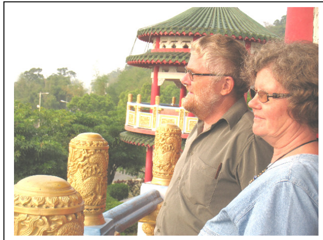
Etiopianpalmut Taiwanissa 2009

”Samalla kun rukous on välttämätön, se on myös vastustamaton. Mikä tuntematon, kuvaamaton voima ja siunaus onkaan varattu meille taivaassa! Se voima voi tehdä meidät siunaukseksi toisille ihmisille, kykeneviksi mihin työhön tahansa ja kohtaamaan jokaista vaaraa ja vaikeutta.”