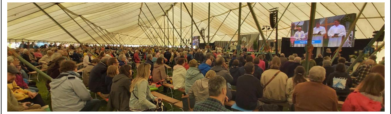
KESÄJUHLIA - Kuva yllä ja vas. Kansanlähetspäivät Ryttylässä; Kuva alla vas. KL-päivillä siunattiin uusia lähettejä – myös lapset siunattiin; Kuva alla oik. Herättäjäjuhlat Salossa; ”satuimme” istumaan etiopianlähettiveriemme viereen seurakentällä.