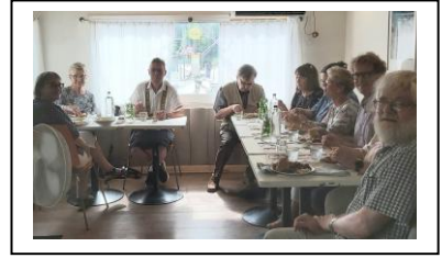
Kuvat yllä: Etiopianlähettien ”kuukausilounaalla” olimme koolla (vas.) heinäkuussa Pitäjänmäellä Abyssinia-ravintolassa ja (kesk. ja oik.) elokuussa Martinlaaksossa GeteDeli -ravintolassa.