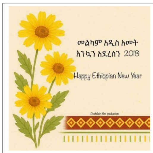
Kuva yllä: Etiopian kalenterissa Uusi Vuosi alkaa syyskuussa. Nyt alkoi vuosi 2018.