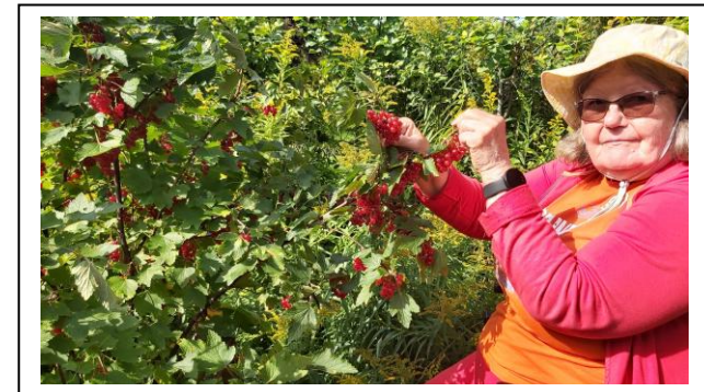
Kuvat yllä: Punaherukan poimintaa heinä-elokuussa.