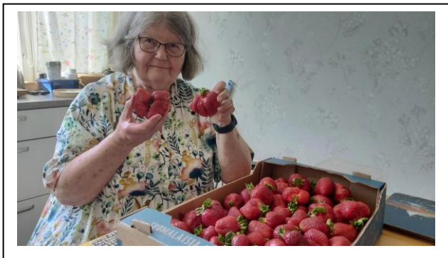
Kuvat alla: Ukonpolulla mansikoita ja mustaherukoita pakkaseen.