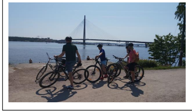
Kuvat yllä: Heinäkuussa kiersimme Tampereen-perheemme kanssa pyörillä Helsingin rantoja; Vas. Ruoholahdessa, taustalla Lauttasaari; oik. Kulosaarissa, taustalla uusi Kruunuvuorensilta.