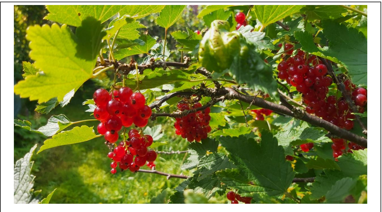
Kuva alla: Punaherukkaa Palmurannassa kesällä 2025