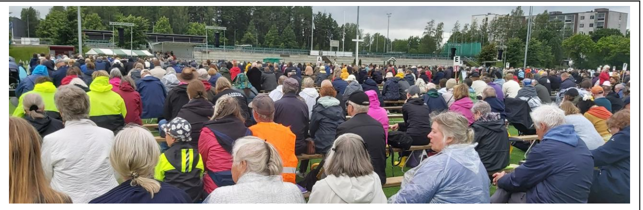
KESÄJUHLIA - Kuva yllä: Herättäjäjuhlat Salossa; Kuva alla vas. Hengelliset syventymispäivät Järvenpäässä. Kuva alla oik. KIRKKOVIERAILU Helsingin Mustasaaren kappelissa.