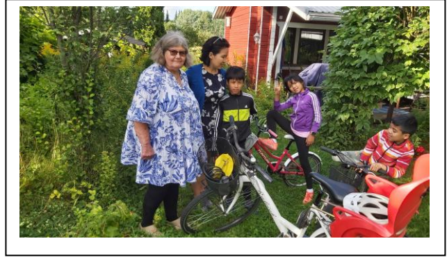
VIERAITA PALMURANNASSA - Kuvat yllä: Heinäkuiset pihaseurat pihanurmella; Bonus-lastenlapsemme palattuaan äitinsä kotimaasta Singaporesta elokuun alussa; Kuvat alla: Siskokset elokuussa, Ystäväröuva Kaivokselan-naapuritalosta syyskuussa.