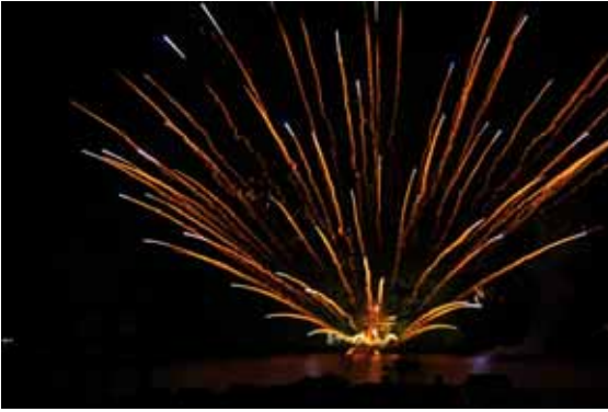
Nojiri-järvellä järjestetään joka kesä ilotulitus. Erikoisuutena on veden pinnalla räjähtävät ilotulitteet. Mitäköhän kalat pitävät näistä paukuista?