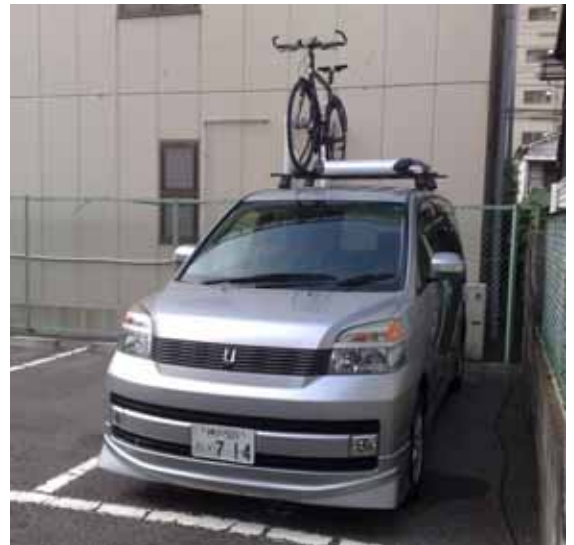
Toyota Voxy lausutaan "bokushii". Sana "pastori" lausutaan puolestaan "bokushi".