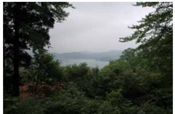
Metsän keskellä olevalta lomamökkimme parvekkeelta avautuu näköala järvelle...