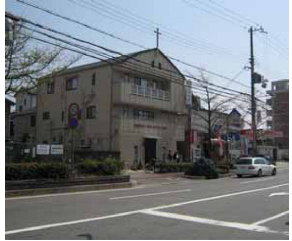
Kotimme ja työpaikkamme!

Ulkomaalaiskortit saimme kaupungintalolta myös samaisena perjantaina. Alun perin hakemusta jätettäessä he lupasivat kortit vasta tiistaille, jolloin meidän olisi pitänyt jo olla lomalla. Varsin hyvä ajoitus! (LP)