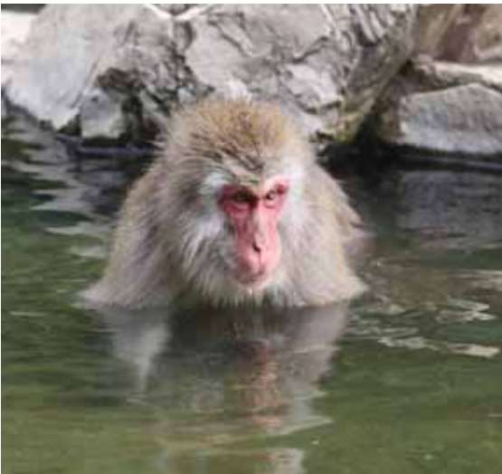
Kuka sanoi, että eläimet eivät pidä vedestä? Tämä apinauros ainakin nauttii kuuman lähteen lämmöstä. Kesälomaan kuuluu vierailu apinapuistossa.