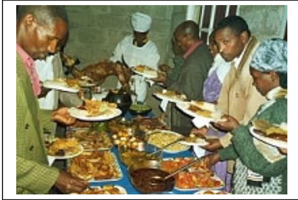
Lähetystyo on juhlaa! Awasan avioliitto-kurssin päätösillallinen helmikuussa 2001.