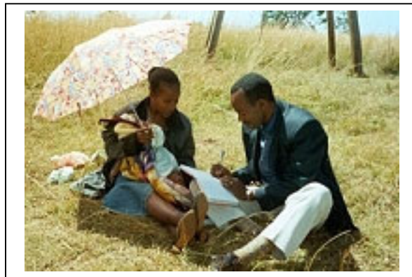
"Keskustellaanko meidän avioliitossamme?" - Hagere Mariamin hiippakunnan nuorisosihteeri nuorikkonsa kanssa parikeskustelun aiheita pohtimassa helmik. -01.

"Ylös noussut Herra, tule meidän keskellemme, havahduta meidät sinun läsnäoloosi, avaa meille ylistyksen portti, näytä meille elämän tie. Auta meitä luottamaan, että sinä olet meidän kanssamme nyt ja aina."